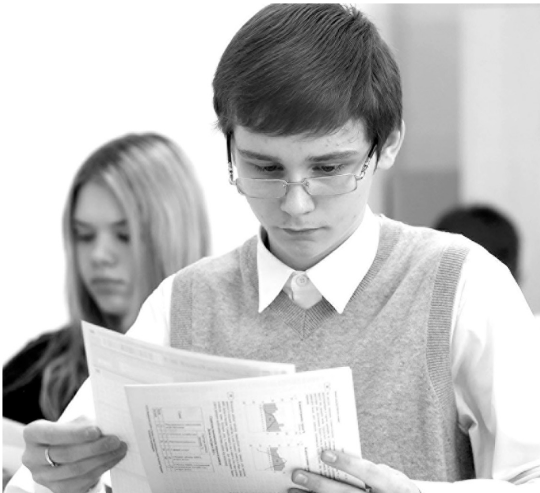
На ЕГЭ главное — подготовка и вера в себя

Надуманные страхи тоже бывают разными, их объединяет лишь общая формулировка «боюсь не сдать ЕГЭ». Реально же люди боятся конфликта с родителями, бояться лишиться чего-то имеющегося или не получить того-то обещанное. То есть предельно страха тут не столько сам экзамен, сколько его неприятные последствия. Люди волнуются