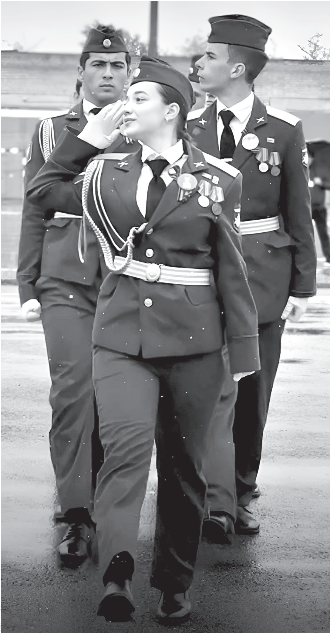
Строевую подготовку демонстрирует команда «Крылья России»