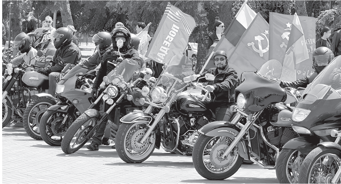
Участники автомотопробега на центральной площади Черкесска