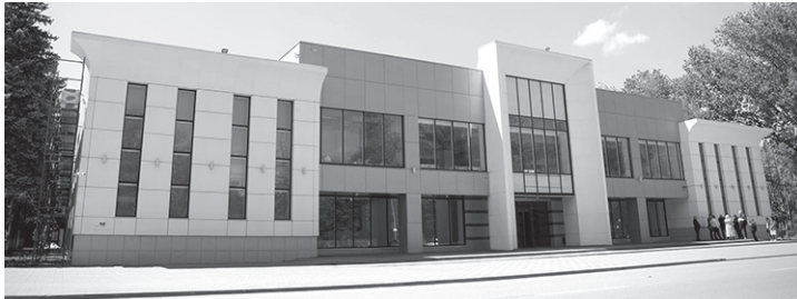
Дворец культуры в Черкесске преображается на глазах