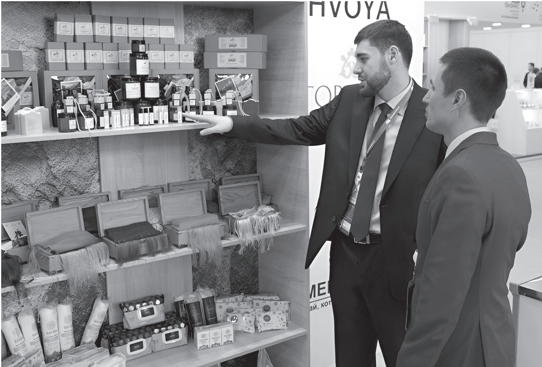
Участники форума с интересом знакомятся с экспозицией Карачаево-Черкесии

На стенде, подготовленном Министерством экономического развития КЧР, были представлены как крупнейшие пред-